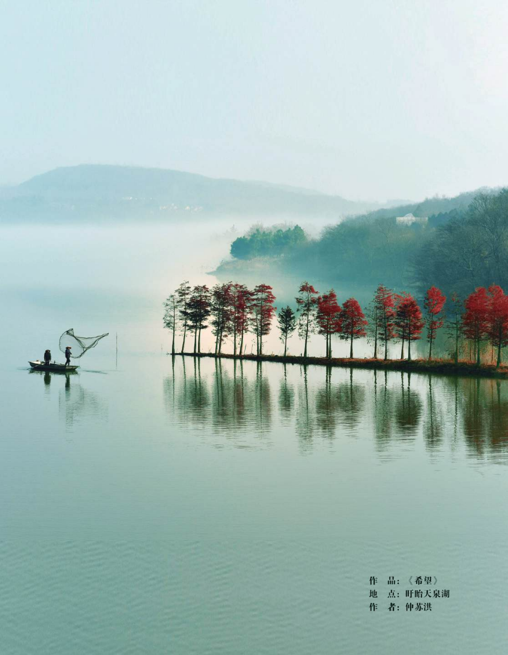
作 品：《希望》 地 点：盱眙天泉湖 作 者：仲苏洪