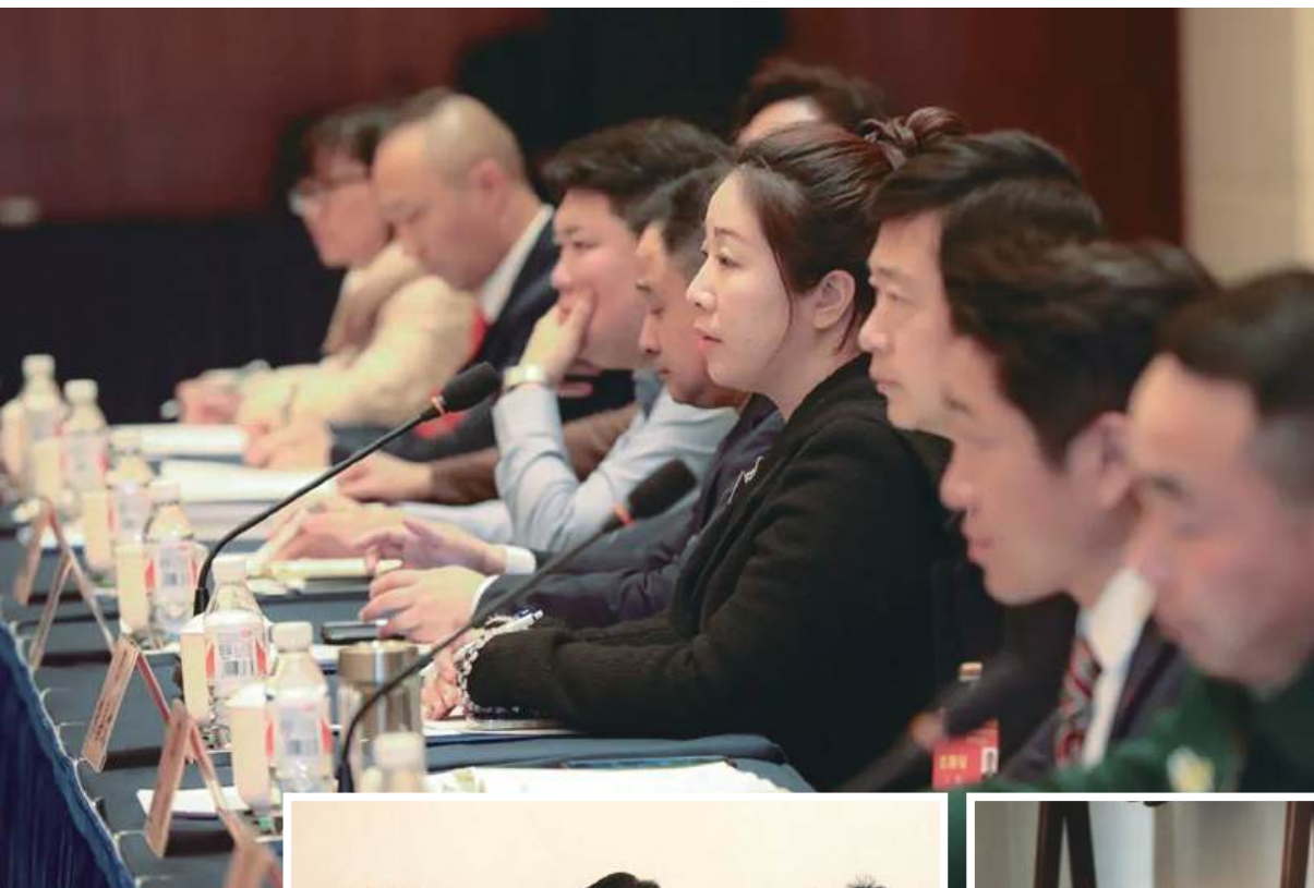
分组讨论现场， 委员们踊跃发言，气 氛热烈。