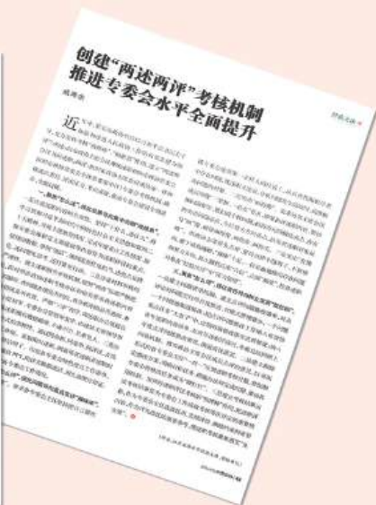
▲ 2024年第3期《中国政协》杂志报道市政协“两述两评”经验做法。