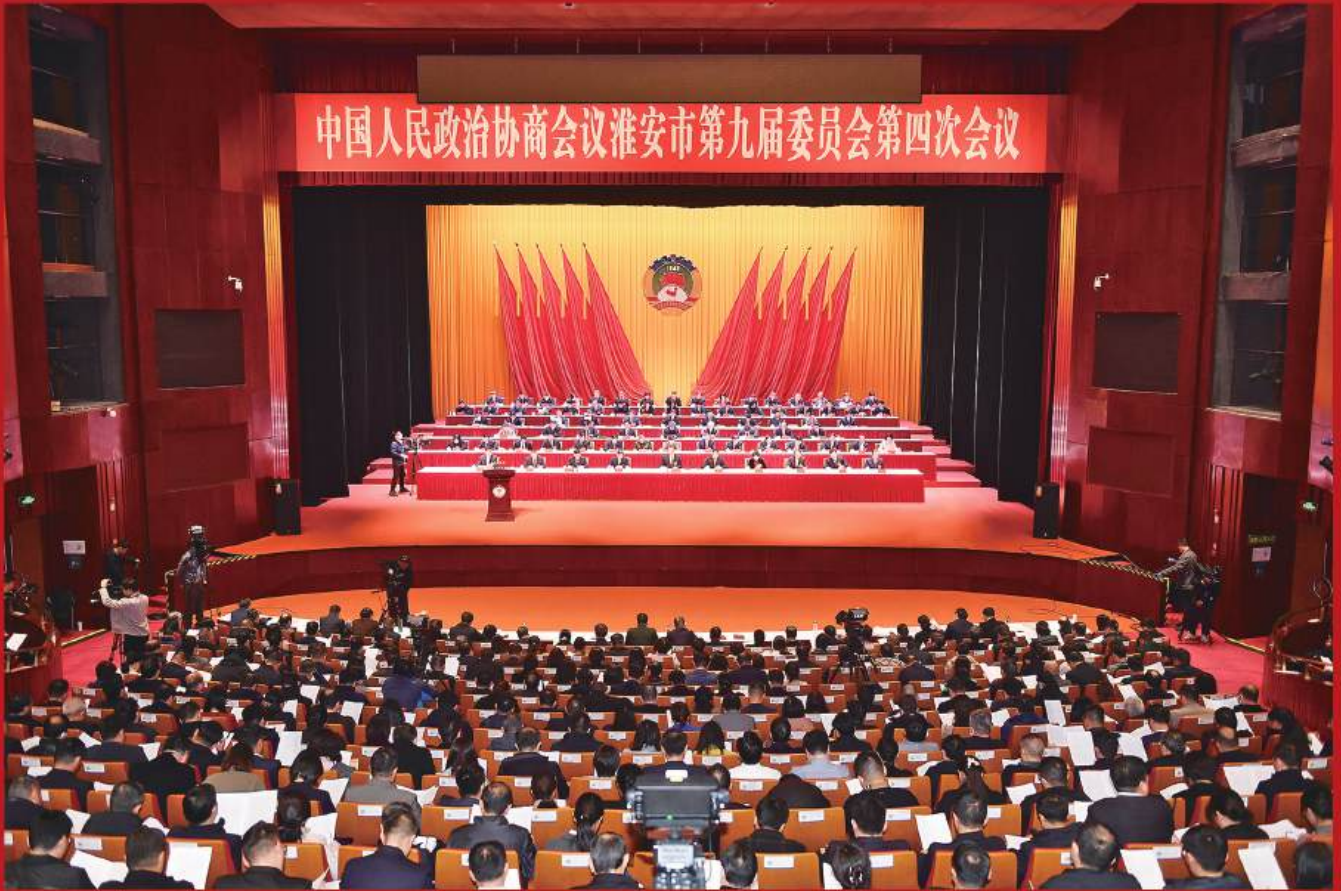
2025年1月13日上午，中国人民政治协商会议淮安市第九届委员会第四次会议在淮安大剧院隆重开幕。